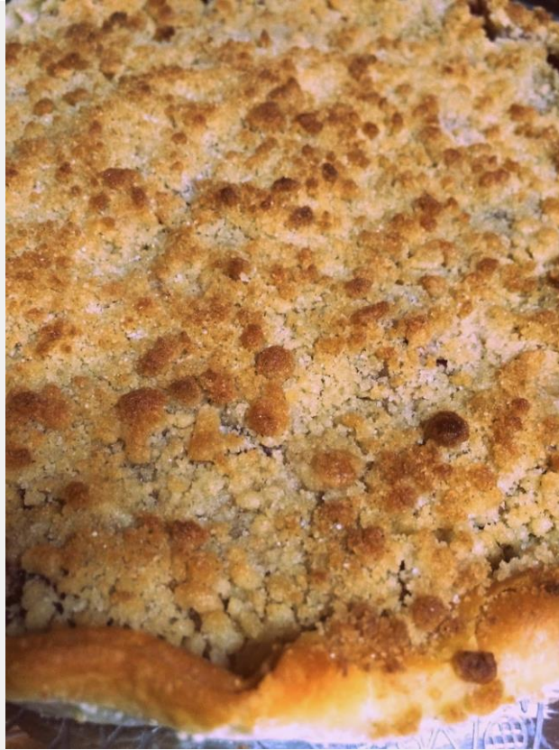
Uma tarte de crumble com mirtilos que toda a gente cá em casa adorou. Receita daqui .